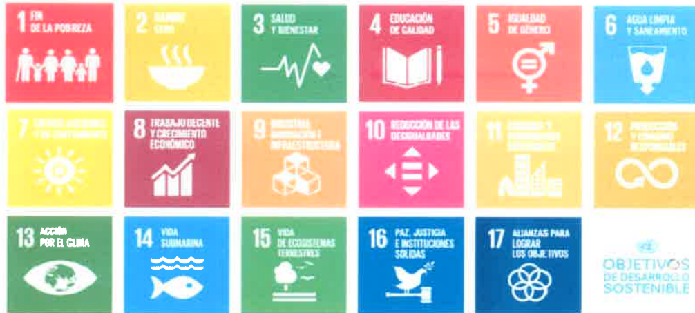
Figura 2. ODS establecidos por la ONU 5 .

La propuesta debe estar alineada a al menos una de las metas propuestas de los Objetivos globales para erradicar la pobreza, proteger el planeta y asegurar la prosperidad para todos como parte de una nueva agenda, la conocida como Agenda 2030, que recoge los 17 objetivos de desarrollo sostenible (ODS) establecidos por la Organización de las Naciones Unidas (ONU).