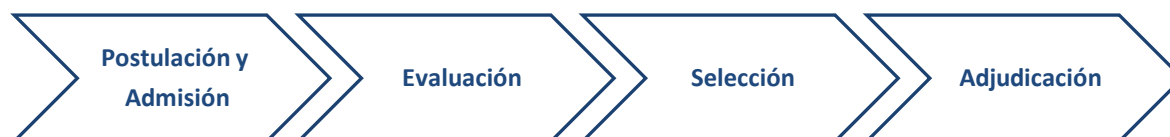
Figura 4. Procedimientos para la convocatoria.

En el siguiente esquema se pueden visualizar los procedimientos de la presente convocatoria: