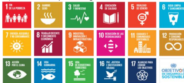
Figura 2. ODS establecidos por la ONU. Fuente: Naciones Unidas (2018) 5

La propuesta debe estar alineada a al menos una de las metas propuestas de los Objetivos globales para erradicar la pobreza, proteger el planeta y asegurar la prosperidad para todos como parte de una nueva agenda, la conocida como Agenda 2030, que recoge los 17 objetivos de desarrollo sostenible (ODS) establecidos por la Organización de las Naciones Unidas (ONU).