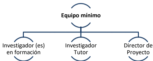
Figura 3. Conformación del equipo mínimo del proyecto.

El Equipo del proyecto deberá estar conformado mínimamente por: investigador(es) en formación, investigador tutor y el Director del Proyecto (ver figura 3),