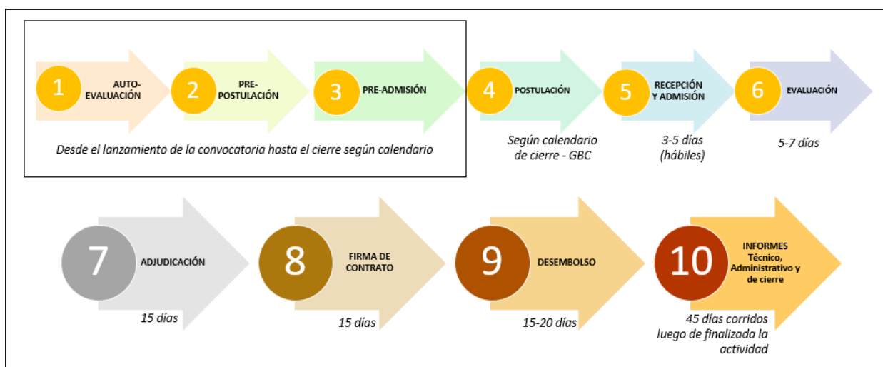
Figura 3. Etapas de la postulación